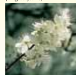
Cherry Plum (Kirsebærblomst)