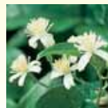
Clematis (Tysk klematis)