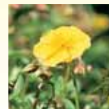
Rock Rose (Vanlig solrose)