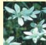
Star of Bethlehem (Fuglestjerne)